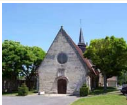
La Chiesa di Trosly-Breuil

Lei continua – discretamente come sempre – a vegliare su di me e su ciascuno di noi." (tratto dalla Lettera di Jean)